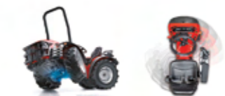
ΑΣΤΙΟ ΔΙΠΛΗΣ ΚΑΤΕΥΘΥΝΣΗΣ